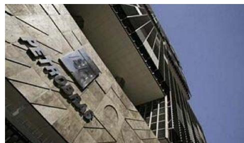
Petrobras S.A. Hauptsitz in Rio de Janeiro

Die Firma gliedert sich in vier Geschäftsbereiche: Exploration & Production, Supply, Gas & Energy und International, unterstützt von den administrativen Bereichen Finance und Services, sowie verschiedenen Stabsfunktionen, die direkt an den CEO berichten. Die Distribution liegt in den Händen eines Tochterunternehmens.