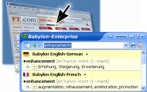
Abb.2: Nachschlagen per Mausclick mit Babylon

40 Mitarbeitern im Einsatz und bewährt sich täglich. Neben dem Hauptglossar wurde auch eine Systemliste im BGL-Format erstellt, die die Software-Architektur referenziert und jeweils Systeme und Subsysteme, bzw. Funktion, Unterfunktionen und Zugehörigkeit darstellt. Sie enthält etwa 1.000 bis 2.000 Einträge.