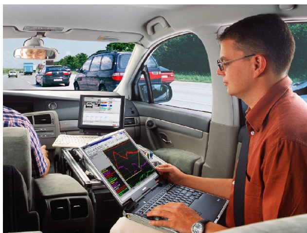
Abb.3: Entwicklung der elektronischen Steuersysteme bei Bosch, Feinabstimmung auf Testfahrten

Die Babylon-Technik erleichtert das Arbeiten mit der riesigen Software-Dokumentation enorm. Ein einziger Klick auf die Kurzbezeichnung einer Variable oder eines Parameters genügt, um im Bruchteil einer Sekunde die Langbeschreibung der Kenngröße auf den Bildschirm zu holen. Ein Blättern oder Suchen in der PDF-Datei entfällt. „Babylon erspart uns nicht nur viel Zeit beim Arbeiten mit der Dokumentation, sondern ist eine große Entlastung, weil der Arbeitsfluss nicht durch Nachschlagen unterbrochen wird“, erklärt ein Nutzer aus der Bosch-Softwareentwicklung. „Angenommen, Babylon spart uns zehn Minuten Zeit am Tag ein, so amortisieren sich die relativ geringen Kosten für die Lizenz in einer Woche.“ Die Investition für die Entwicklung des automatischen Konvertierungstools hat sich bereits nach wenigen Monaten bezahlt gemacht. Die Babylon-Lösung ist inzwischen seit zwei bis drei Jahren im Einsatz und läuft problemlos.